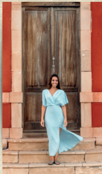
Calidad de vida